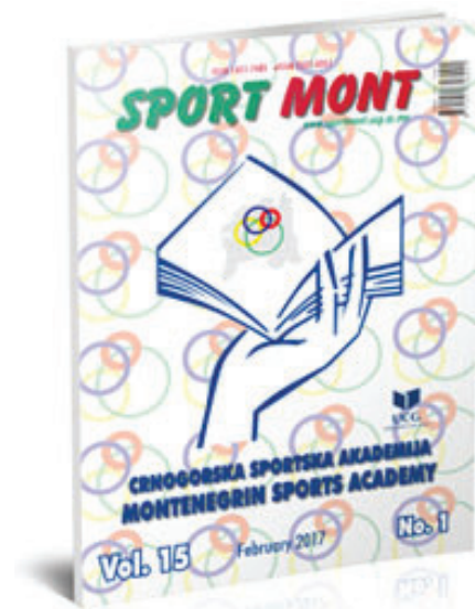
Slika 1. Časopis Sport Mont Vol. 15 No. 1 (2017)

U tom periodu objavljeno je 28 radova predavača sa pomenu- te univerzitetske jedinice. Dakle, istraživački radovi u ovoj analizi sadržaja su klasifikovani po oblastima kojima pripadaju, a izdvo-